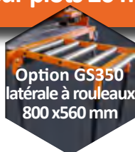
Option GS350 latérale à rouleaux 800 x 560 mm